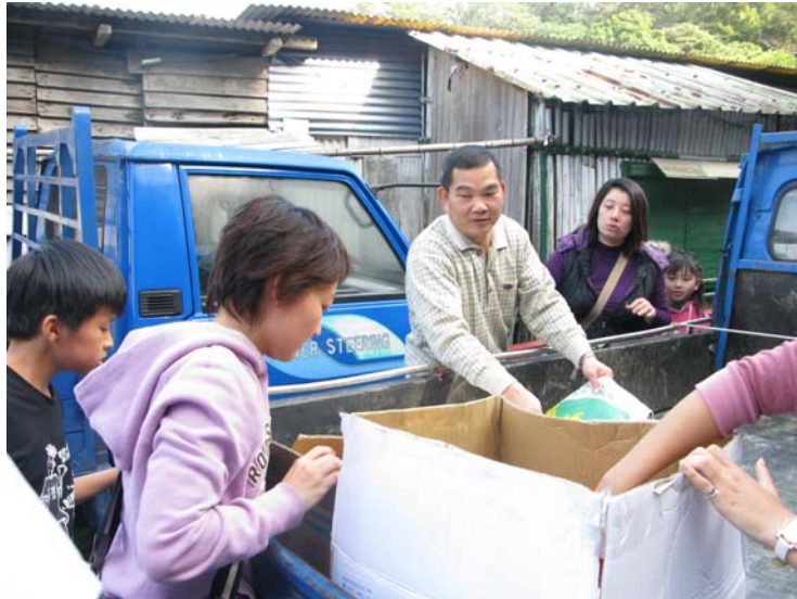
捐贈之物資—白米/沙拉油/醬油等