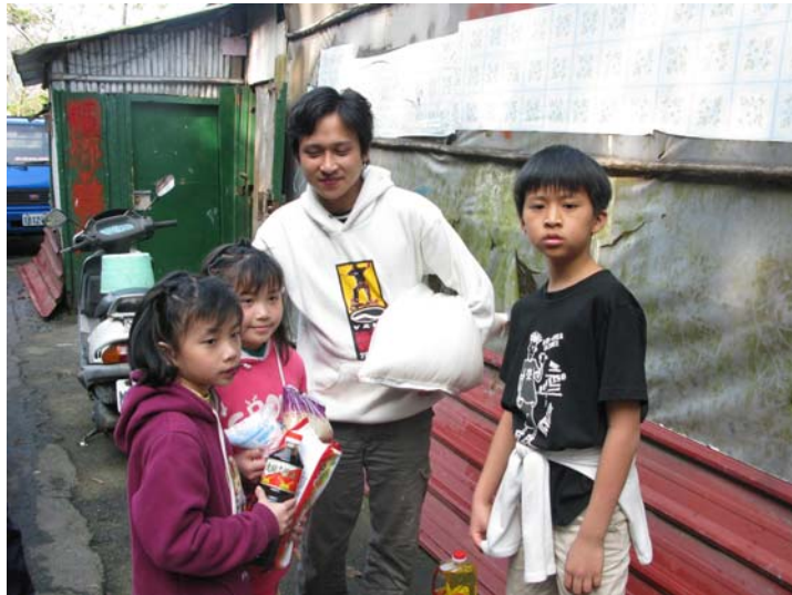
載運物資至受捐助家庭中