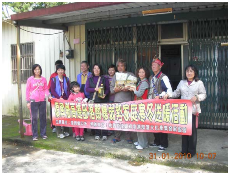
可愛的美國康德基金會志工群